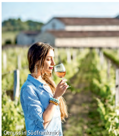
Genuss in Südfrankreich