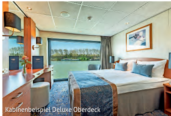
Kabinenbeispiel Deluxe Oberdeck