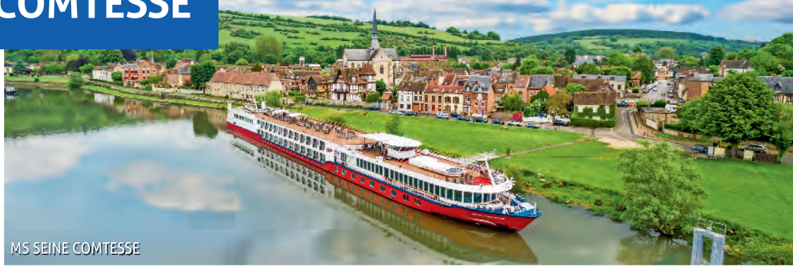
MS SEINE COMTESSE