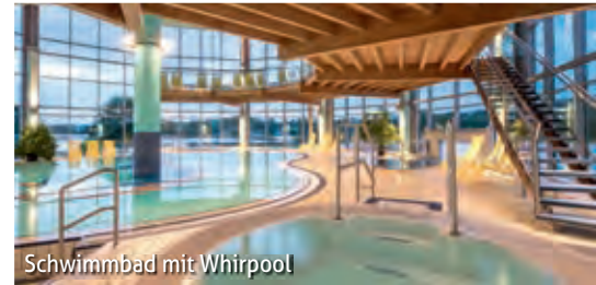
Schwimmbad mit Whirlpool